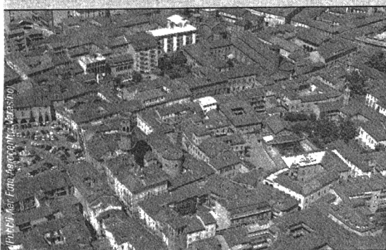
Città in evoluzione. Vercelli in una panoramica del centro storico

Il peso dei settori primario, secondario e terziario, quanto a valore aggiunto, nel 1965 e nel 2002 a Vercelli